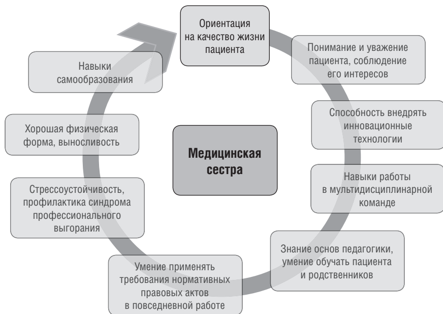
Рис. 2.2. Требования к знаниям, умениям и навыкам и психофизиологическим характеристикам личности медицинской сестры по уходу за неизлечимым пациентом