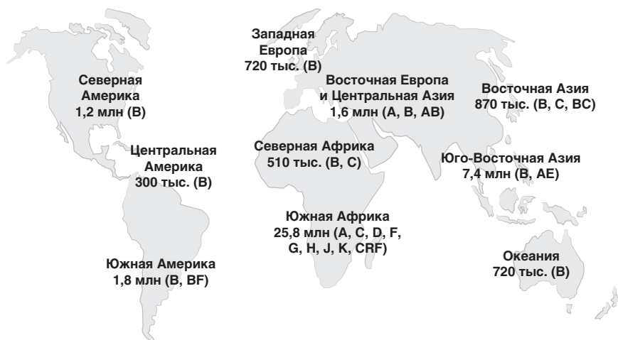
Рис. 2.2. Распределение ВИЧ-1 инфекции в мире (в скобках — преобладающие субтипы)

Учеными ГНЦ ВБ «Вектор» совместно с областным центром по профилактике и борьбе со СПИДом и инфекционными заболеваниями проведена работа по изучению субтипов ВИЧ, циркулирующих среди ВИЧ-инфицированных в Новосибирской области. Данные проведенного исследования представлены на рис. 2.3.