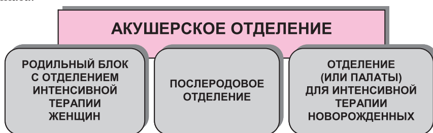
Рис. 1.2. Структура акушерского отделения

Физиологическое (первое) акушерское отделение как самое большое в родильном доме разделяют на родильное отделение (родовой блок с отделением/палатой интенсивной терапии), послеродовое отделение, отделение/палаты интенсивной терапии новорожденных (рис. 1.2). В состав отделения также входят смотровая комната приемного отделения и выписная комната.