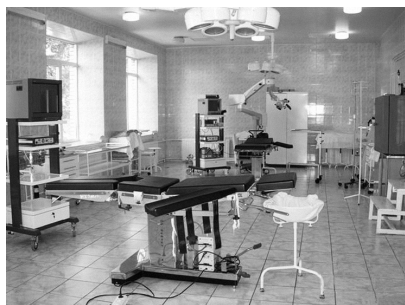
Рис. 2.1. Современный операционный зал

4-я зона по соблюдению мер асептики сопоставима с режимом общехирургического отделения и включает кабинеты заведующего, старшей медицинской сестры, помещение для использованного белья; в ней также располагаются другие вспомо-