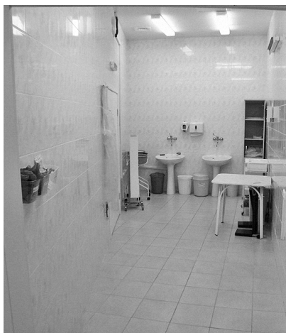
Рис. 2.2. Общий вид предоперационной

Все используемые методы дезинфекции и стерилизации по механизму воздействия подразделяются на физические (термическая, лучевая и УЗ-стерилизация) и химические (стерилизация растворами антисептиков и газовая стерилизация). К химическим методам относят стерилизацию парами формалина, окисью этилена, наддуксной кислотой, а также химиотермическую обработку — эти способы чаще применяются для стерилизации оптических приборов и инструментов. Стерилизация с помощью паров химически активных веществ, газа, растворов химических антисептиков, а также с использованием \gamma -излучения и УФО называется холодной стерилизацией .