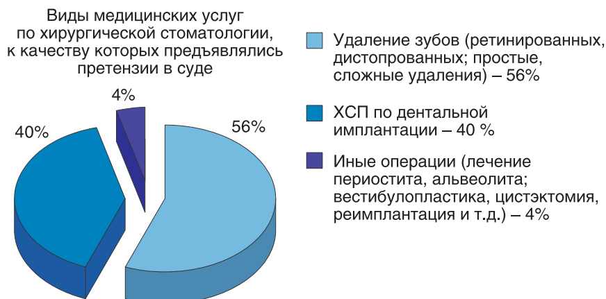
Рис. 1.2. Виды медицинских услуг, оказанных врачами — стоматологами-хирургами, которые стали основаниями для судебных разбирательств (2013–2017)

Принимая во внимание негативные тенденции, связанные с увеличением числа граждан, не удовлетворенных качеством ХСП, и возрастом активности юридического сообщества, а также незавершенность процессов формирования нормативных документов,