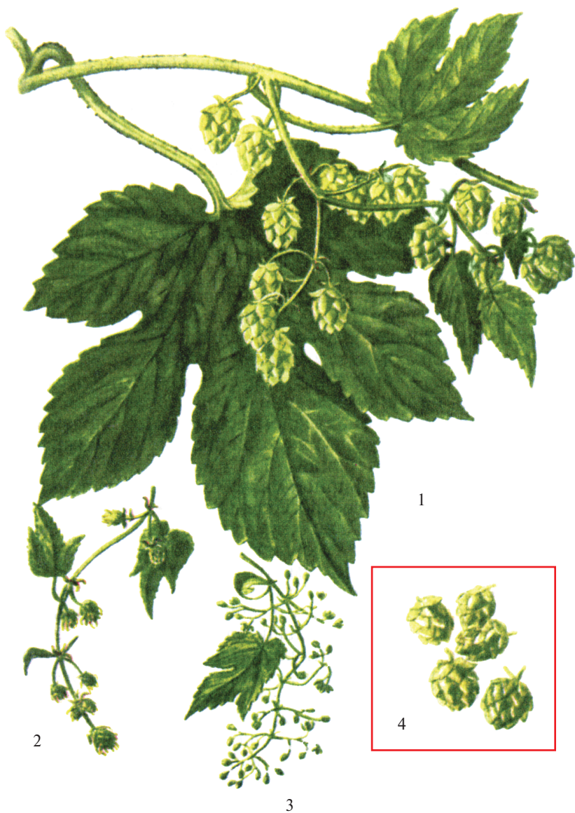
Рис. 8.6. Хмель обыкновенный — Humulus lupulus L.:

1 — ветвь с соплодиями; 2 — соцветия женских цветков; 3 — соцветия мужских цветков; 4 — соплодия