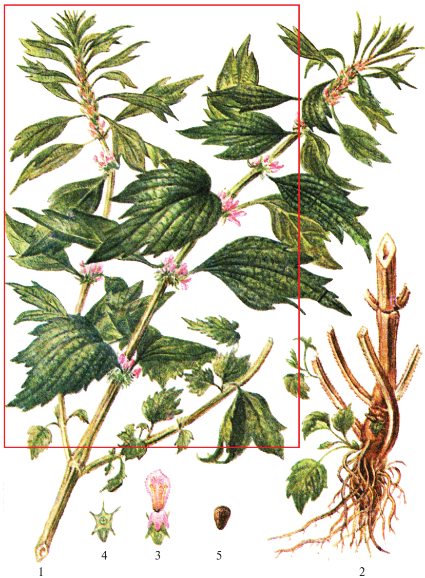
Рис. 8.5. Пустырник сердечный — Leonurus cardiaca L.:

1 — верхняя часть цветущего растения; 2 — корневище с корнями и основаниями стеблей; 3 — цветок; 4 — чашечка с незрелым плодом; 5 — эрем