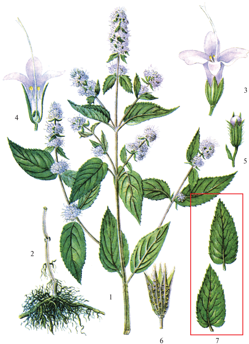
Рис. 8.3. Мята перечная — Mentha piperita L.:

1 — верхняя часть цветущего растения; 2 — корневище с корнями и основанием стебля; 3 — цветок; 4 — цветок в продольном разрезе; 5 — бутон; 6 — чашечка; 7 — листья (сырье)