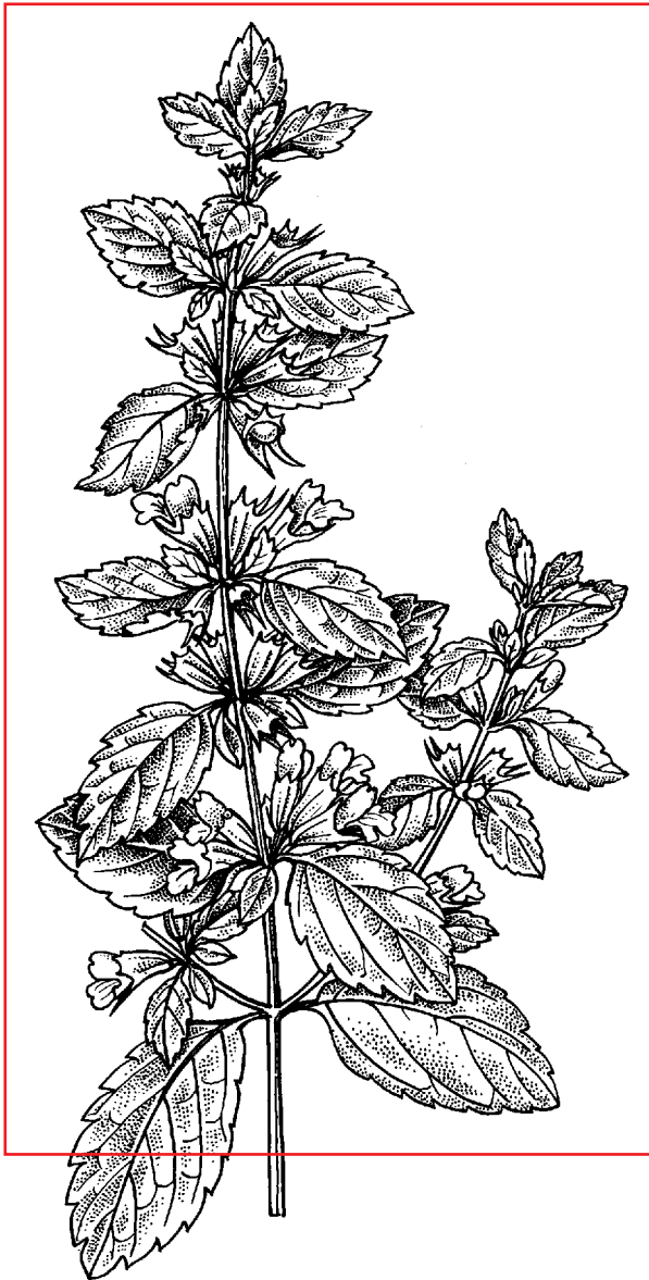
Рис. 8.2. Мелисса лекарственная — Melissa officinalis L. — верхняя часть цветущего растения