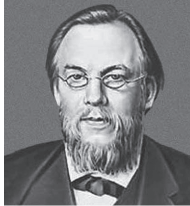
Сергей Петрович Боткин

Алексей Александрович Остроумов (1844–1908) — русский клиницист-терапевт. Первые работы А.А. Остроумова носили экспериментально-физиологический характер. А.А. Остроумов установил невrogenный характер отеков (1879) и потоотделения. Он утверждал, что тяжесть заболевания определяют не морфологические изменения, а состояние нервной системы. В своих