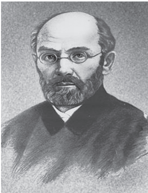
Григорий Антонович Захарьин

Учение о диетотерапии развивалось в зависимости от успехов медицины, биологии, общефилософских взглядов в тот или иной период.