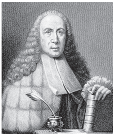
Джованни Баттиста Морганьи