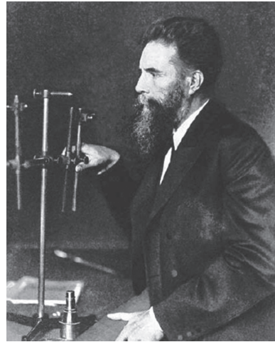
Вильгельм Конрад Рентген