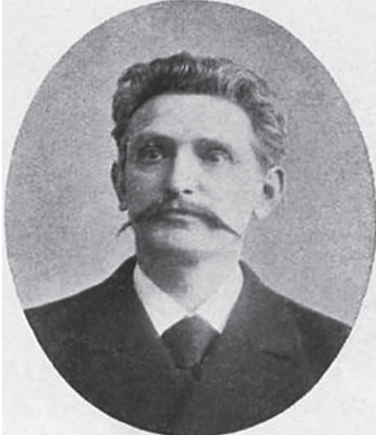
Карл Антон Эвальд