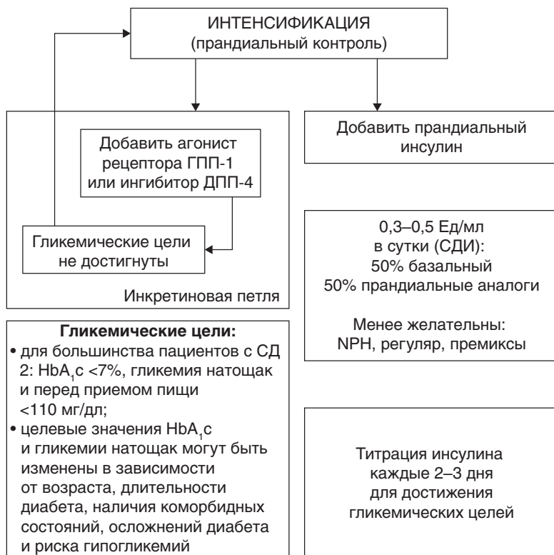
Рис. 1.4. Инкретиновая петля в алгоритме Американской ассоциации клинических эндокринологов (2013). Адаптировано согласно A.J. Garber et al. [4]

Положительный опыт использования инкретинов, в частности агонистов рецепторов ГПП-1, отражен в новых редакциях гайдлайнов всех ведущих диабетических ассоциаций. Так, в Обновленных алгоритмах Американской ассоциации клинических эндокринологов (2013) впервые законодательно была утверждена инкретиновая петля, предполагающая в качестве первого шага интенсификации прандиального контроля у пациентов, получающих базальный инсулин, назначение инкретинов, что позволяет отложить использование базис-болюсной инсулинотерапии (рис. 1.4). Кроме того, использование инкретиновой терапии способствует достижению большей приверженности лечению и удовлетворенности пациента проводимой терапией, так как использование фиксированной дозы не требует коррекции при изменении гликемической нагрузки пищи и квоты углеводов [4].