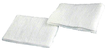
Нестерильные марлевые салфетки