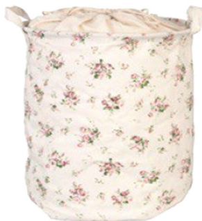
Мешок для грязного белья