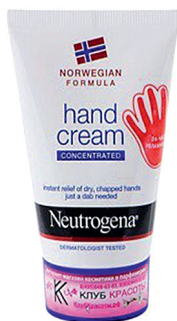
Крем для рук