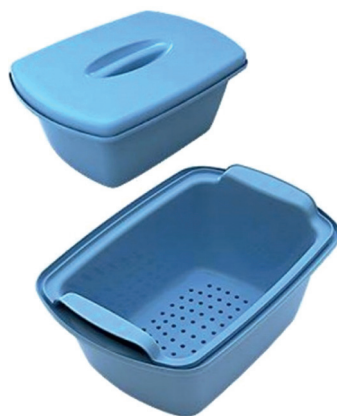
Емкость для дезинфекции (при необходимости)