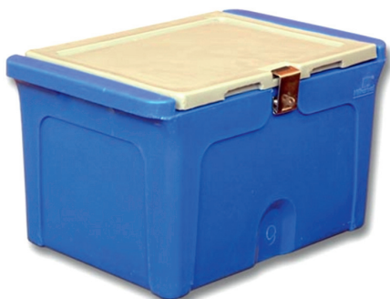
Ящик для банок