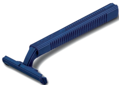
Станок для бритья