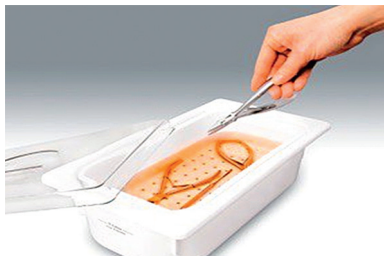
Емкость для дезинфекции