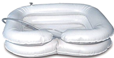
Надувная ванночка (для мытья головы)