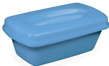
Лоток для использованного материала