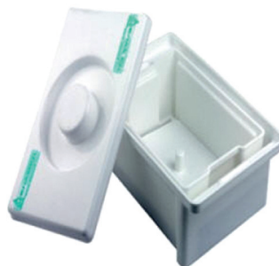
Емкость с водой