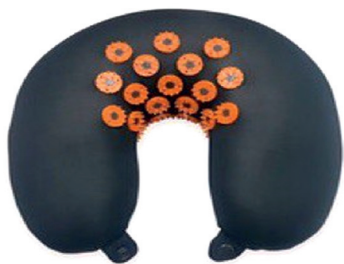
Валик (упор под плечи пациента)