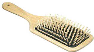
Щетка для волос (или расческа)