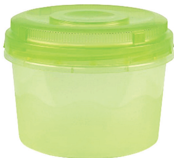
Емкость для воды