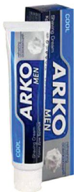
Крем для бритья