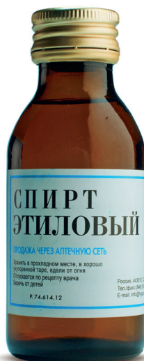
Этанол (Этиловый спирт♦)