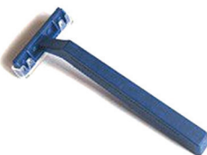
Бритвенный станок (одноразовый)