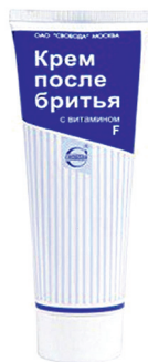
Крем после бритья