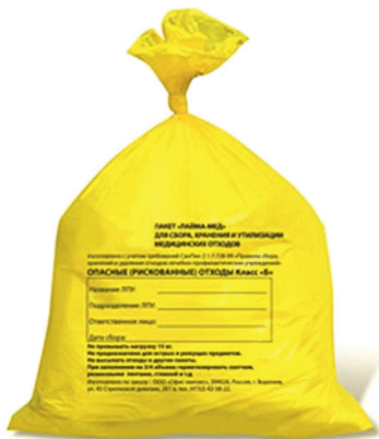
Мешок для отходов класса Б