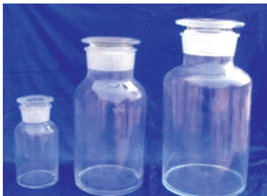
Емкость для воды