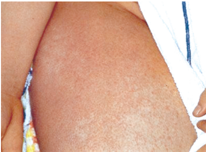
Рис. 25.2. Скарлатинозная сыпь на фоне выраженной гиперемии кожи

Патологическая анатомия. Скарлатинозная ангина вначале возникает как катаральное воспаление, но уже к концу первых суток оно переходит в катарально-гнойное и гнойно-некротическое. При отторжении некротизированных тканей ангина приобретает характер язвенно-некротической. В основе скарлатинозной сыпи — васкулит мелких сосудов в виде их резкой гиперемии, стаза эритроцитов, сладжей (рис. 25.2). Периваскулярное образование лимфомакрофагальных инфильтратов, особенно в дерме, приводит к некрозу эпидермиса. Интоксикация в сочетании с васкулитом приводит к жировой и белковой дистрофии миокарда и печени, отеку головного мозга, поражению вегетативной нервной системы. Иногда развиваются кровоизлияния в надпочечниках. После исчезновения сыпи происходит пластинчатое шелушение эпидермиса, особенно на коже кистей и стоп.