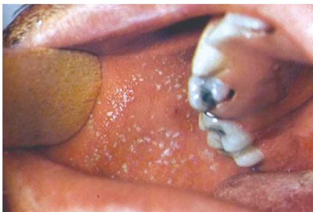
Рис. 25.3. Корь. Пятна Филатова–Коплика на слизистой оболочке щек

Патологическая анатомия. За 1–2 дня до появления сыпи на слизистых оболочках щек, губ, десен, иногда конъюнктивы возникает энантема — мелкие белесоватые точки, окруженные венчиком гиперемии. Энантема в области переходной складки у малых коренных зубов носит название пятен Филатова–Коплика , имеющих диагностическое значение при кори (рис. 25.3). Микроскопически в очагах энантемы обнаруживают сначала гиперемию, отек, лимфогистиоцитарную инфильтрацию, вакуолизацию и некроз, а затем слущивание эпителия. Видны типичные для кори гигантские эпителиальные клетки. Характерна сыпь на коже ( экзантема ). Она носит пятнисто-папулезный характер, возникает вначале за ушами, затем на лице, шее, туловище и конечностях.