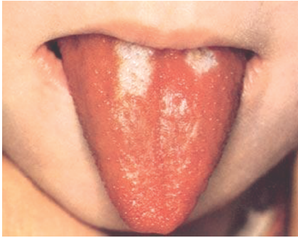
Рис. 25.1. Скарлатина. Малиновый язык

интоксикация с высокой лихорадкой, сенсibilизация организма к стрептококку и измененным антигенам разрушенных тканей. Происходит выработка перекрестно-реагирующих антител.