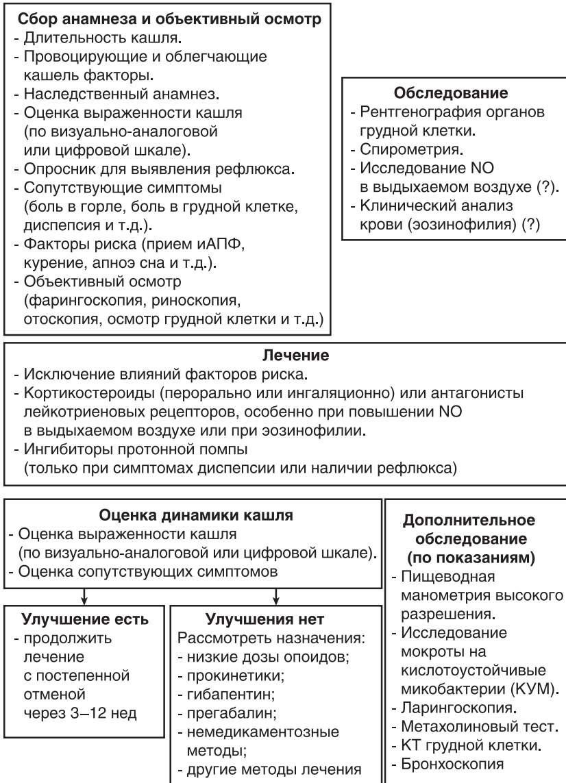
Рис. 3.3. Алгоритм диагностики и лечения хронического кашля (Европейское респираторное общество, 2019)